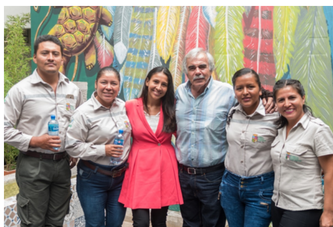
Guardaparques y autoridades del Parque Lomas de Arena.