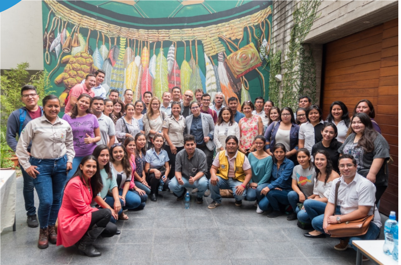
Asistentes al II WORKSHOP 2020