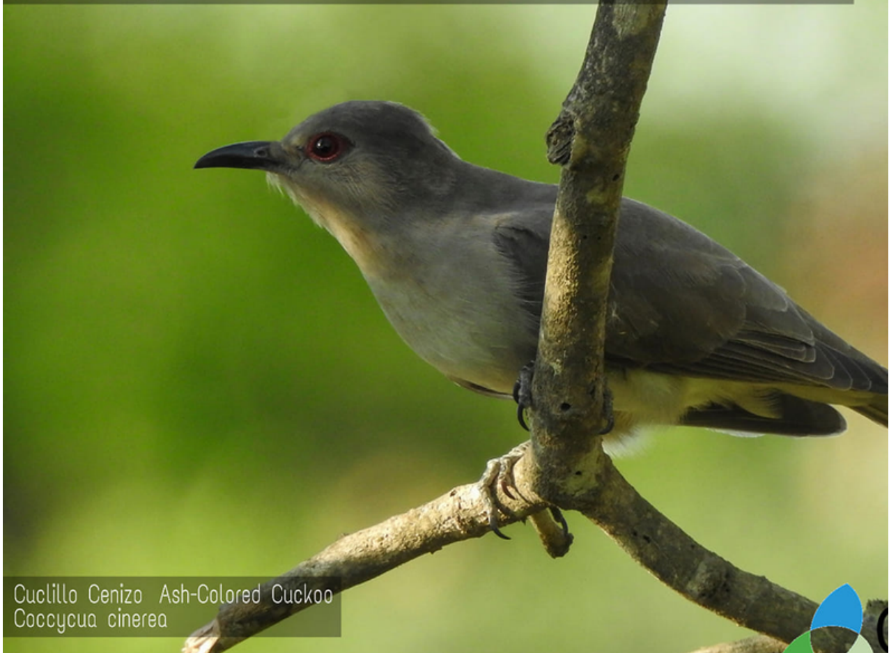
Cuclillo Cenizo Ash-Colored Cuckoo Coccyua cinerea